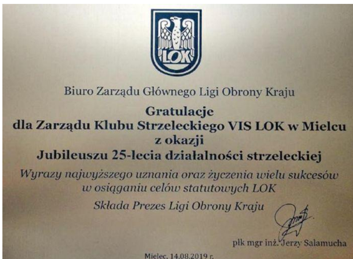
List gratulacyjny Biura Zarządu Głównego Ligi Obrony Kraju dla KS „VIS” LOK w Mielcu