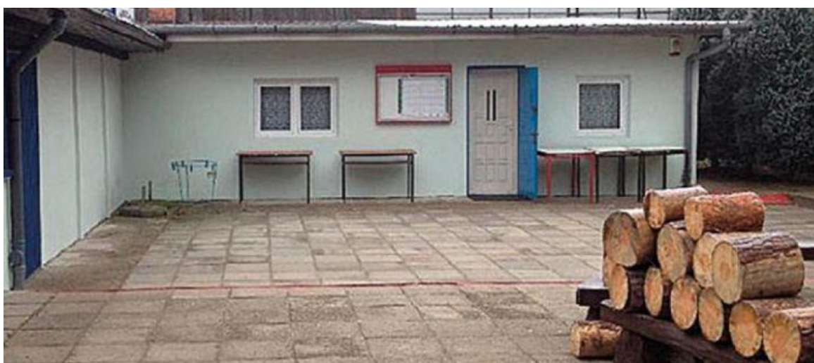
Widok budynku głównego na terenie strzelnicy, z lewej strony znajduje się wejście na strzelnicę. Stan obecny po rewitalizacji.